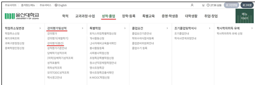
[그림 1-2] 강의평가(중간) 프로그램 접속 경로 화면